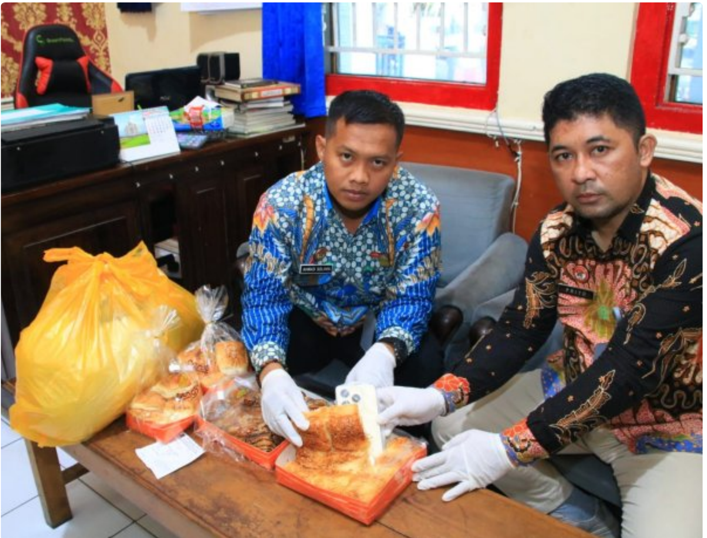
Petugas Lapas Banyuwangi berhasil menggagalkan penyelundupan HP ke dalam lapas

BANYUWANGI - Petugas Lembaga Pemasyarakatan (Lapas) Kelas IIA Banyuwangi berhasil menggagalkan upaya penyelundupan handphone ke salah satu narapidana, Sabtu (18/1/2025). Handphone itu akan diselundupkan oleh B